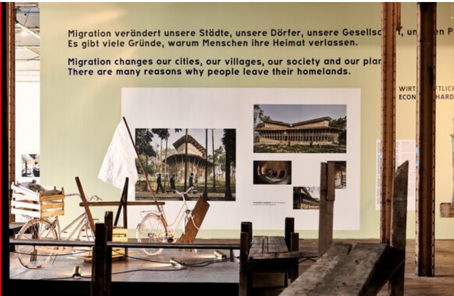
Abb.: Installation von Anna Heringer & Dipdii Textiles und Neven Allanic & Bureau Museal, Foto: HALLE 14 | Walther Le Kon, 2021.