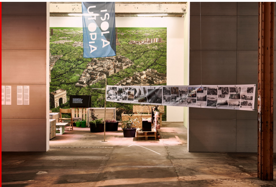
Abb.: Installation von Isola Art Center & out, Foto: HALLE 14 | Walther Le Kon, 2021.