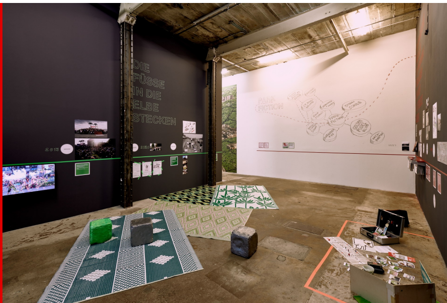
Abb.: Installation von Park Fiction, 2021.