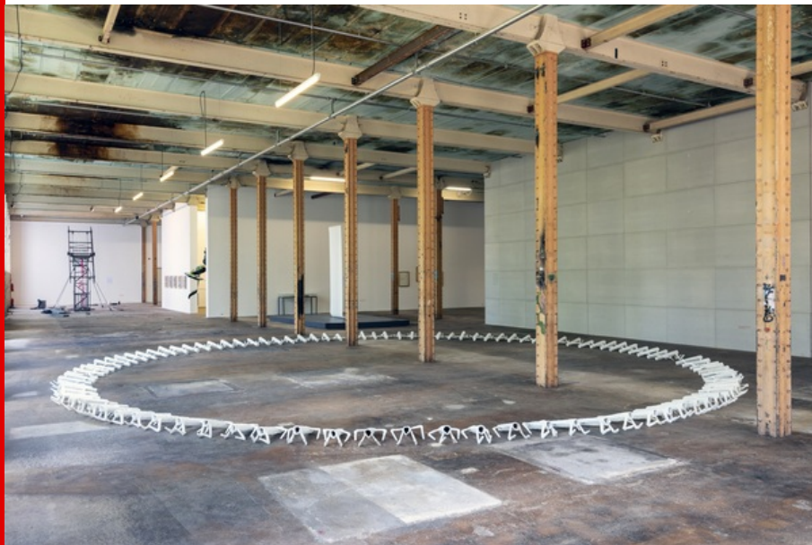
Abb.: Blick in die Ausstellung mit Werken von Mohamad Kanaan, Hiba Alansari & Mahmoud Alansari, Chaza Charafeddine u.a.; Foto: HALLE 14 | Büro Für Fotografie 2022.