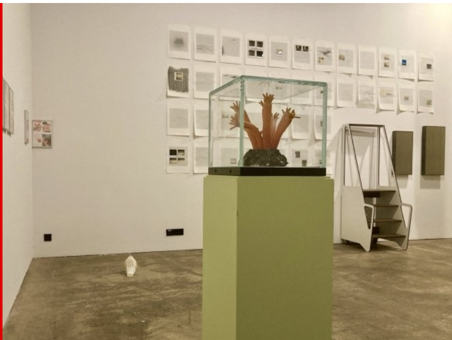
Abb.: Blick in die Ausstellung, 2022; Foto: HALLE 14, 2022.