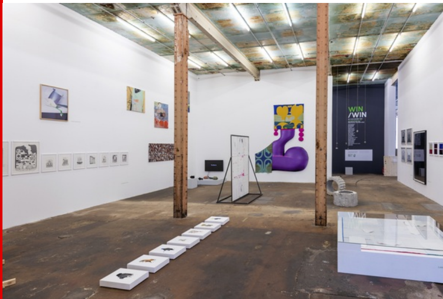
Abb.: Blick in die Ausstellung, 2022; Foto: HALLE 14 | Büro für Fotografie, 2022.